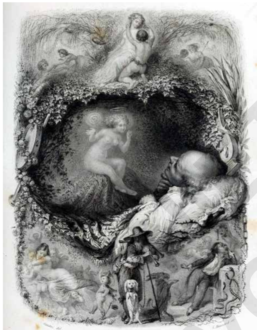
Zielsverhuizing, Auguste Sandoz 1847

Klassiek homeopaat Ewald Stöteler verwierf internationaal een indrukwekkende reputatie in zijn vakgebied. Het is een enorm genoegen om met hem van gedachten te wisselen over hoe disciplines als homeopathie en reïncarnatietherapie elkaar profijtelijk zouden kunnen aanvullen. Bedenk maar eens dat het homeopathisch middel Hydrocyanicum Acidum - door de Duitsers 'Zyclon-B' genoemd, waarmee talloze mensen tijdens de Tweede Wereldoorlog werden vergast - een ongelooflijk ondersteunende, deblokkerende rol zou kunnen spelen voor mensen die in een reïncarnatietherapeutische sessie ervaren te zijn vergast. Of dat Aurum als homeopathisch middel ingezet kan worden als iemand ontdekt zelfmoord te hebben gepleegd in een uitzichtloos vorig leven