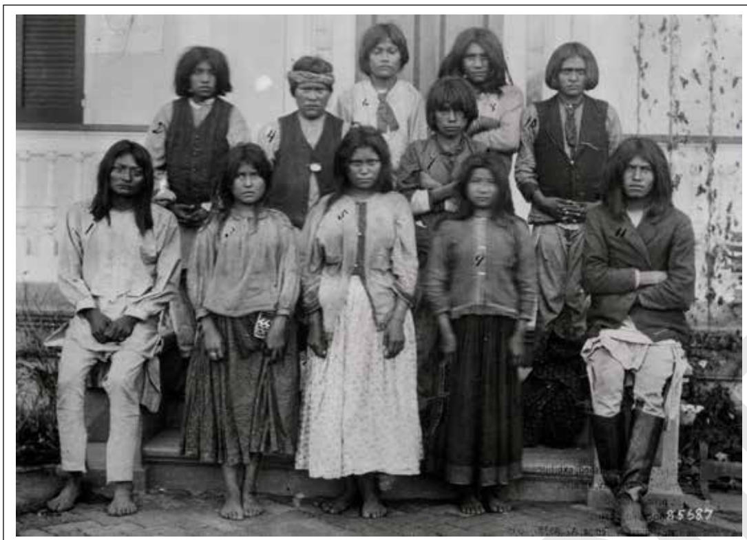
Apache kinderen bij aankomst en vier maanden later op de Carlisle Indian School (Pennsylvania), 1886