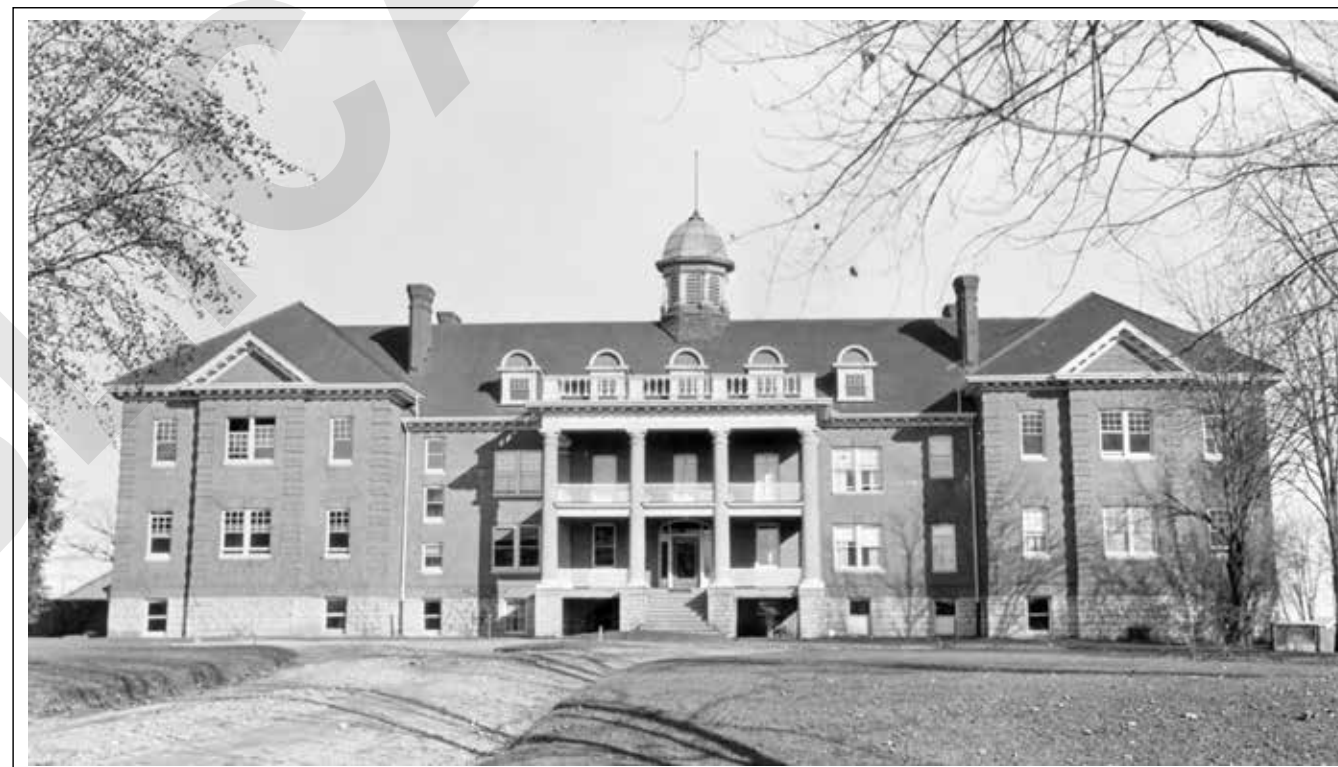
The Mohawk Institute in Brantford