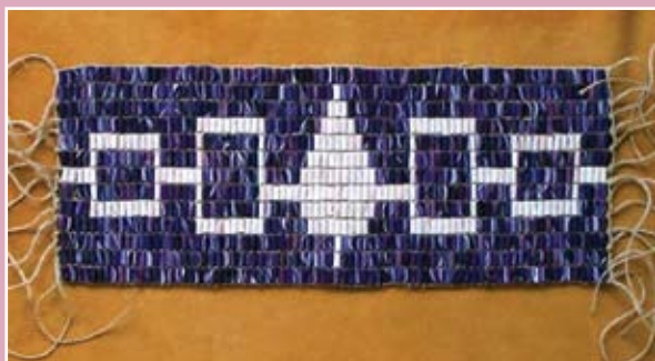
Het symbool, of de vlag van de Six Nations (ook gemaakt van Wampum)

Met name de laatste decennia worden 'bij